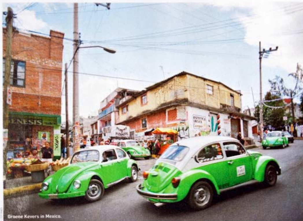
Groene Kevers in Mexico.